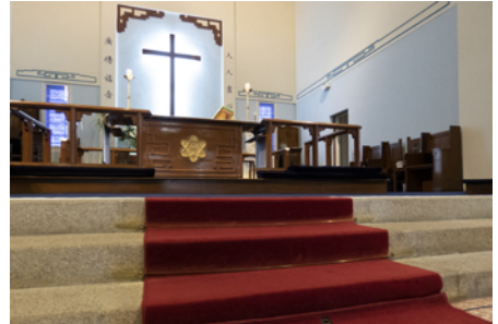
教堂內聖所前三級台階