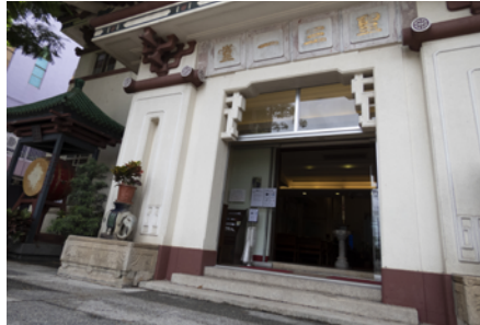
教堂門前三級台階