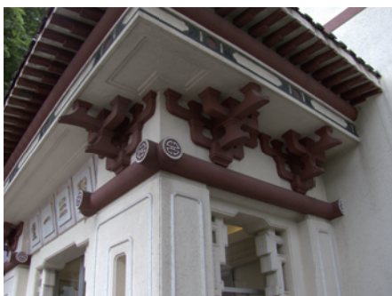
「壽」字圖紋 (照片中有五個半壽字圖紋， 找到嗎?)