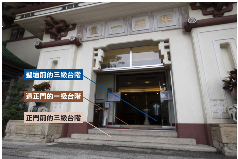
從正門到聖壇的三組台階